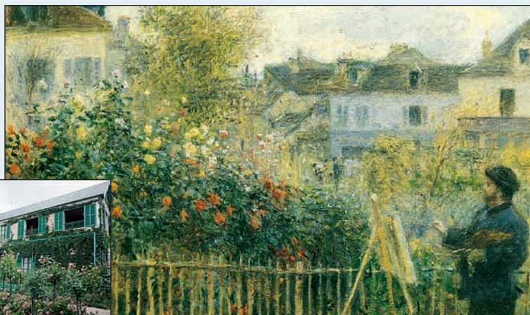
Renoir, «Monet peignant dans son jardin»

Après la mort de Monet, la maison de Giverny et son jardin ont été abandonnés. Heureusement, grâce à° la générosité d'une riche Américaine, cette maison a été récemment restaurée et le jardin recréé dans sa splendeur originale. Aujourd'hui des centaines de milliers de visiteurs venus du monde entier viennent chaque année à Giverny saluer la mémoire du grand artiste français et admirer son merveilleux jardin.